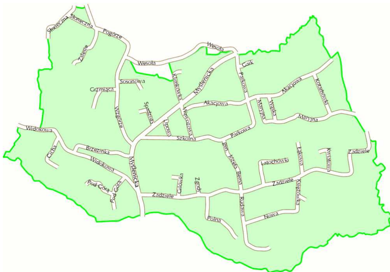
Rysunek 4 – Mapa Gaja z ulicami.

Wszystkim ulicom zostały nadane nazwy, co znacznie podniosło estetykę sołectwa.