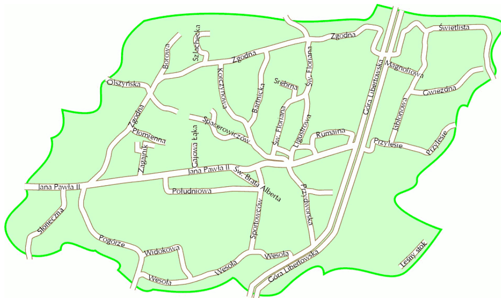
Rysunek 4 – Mapa Libertowa z naniesionymi ulicami.

Ulicom w Libertowie zostały nadane nazwy, co znacznie poprawiło komunikację w sołectwie.