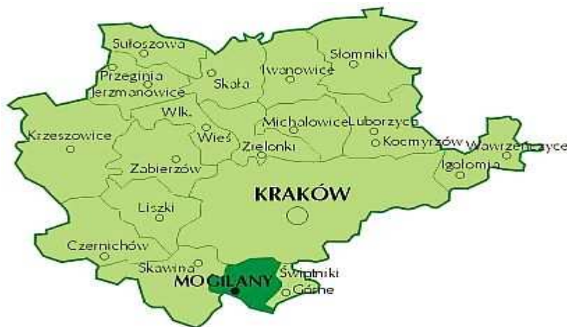
Rysunek 1 – Położenie Gminy Mogilany na tle powiatu krakowskiego.

Położenie Gminy Mogilany na tle powiatu krakowskiego przedstawia rysunek nr 1, natomiast szczegółową lokalizację sołectwa Libertów na tle Gminy Mogilany prezentuje rysunek nr 2.