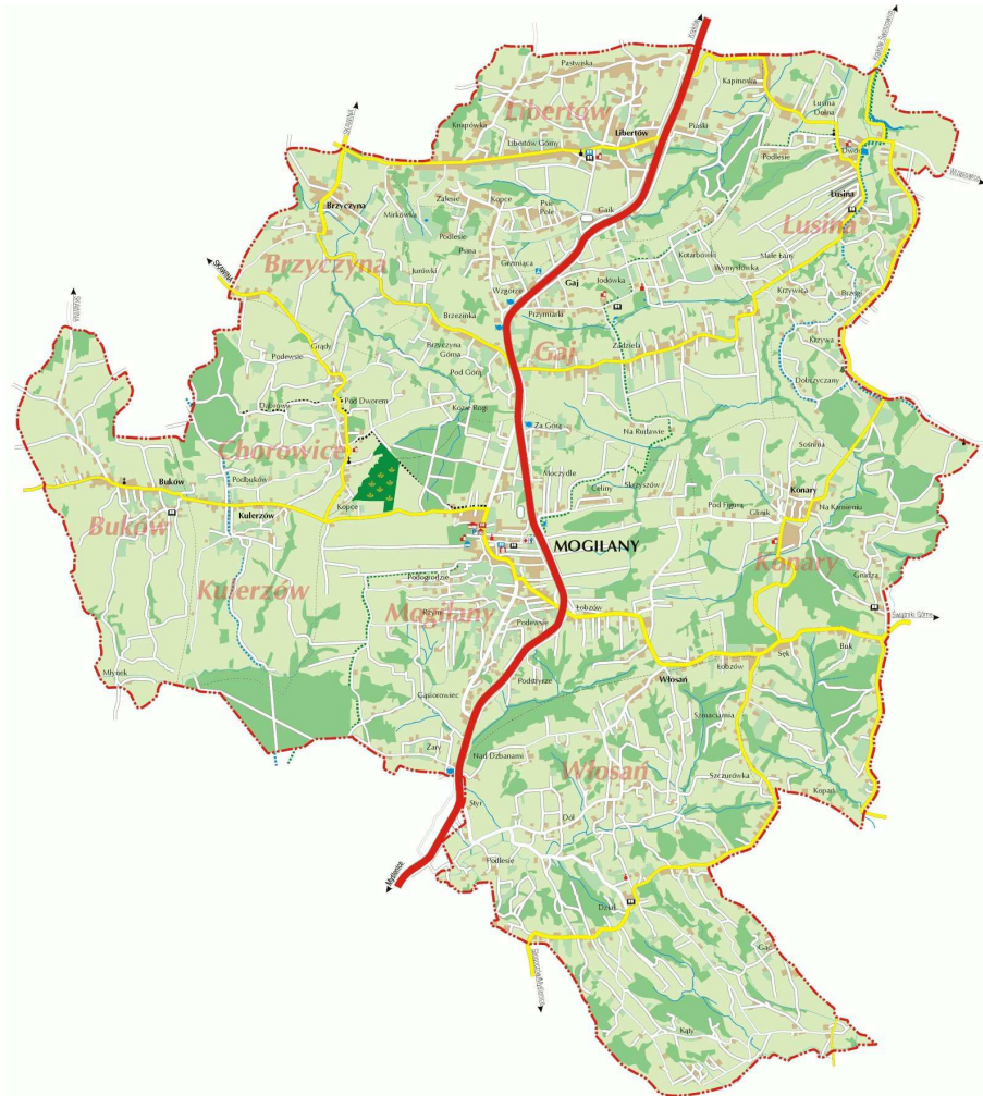
Rysunek 2 - Podział Gminy Mogilany na sołectwa.

Szlaki turystyczne przebiegające przez teren Gminy Mogilany: