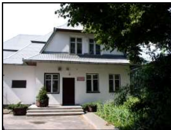
Obecny budynek Biblioteki