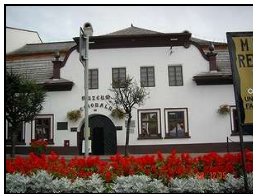
Dom na Dołkach