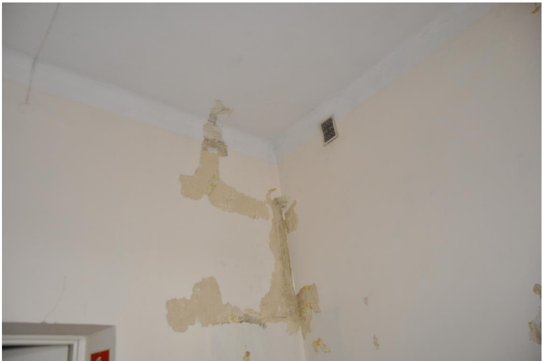
Fot. 29. Jordanów. Rynek nr.2 Budynek dawnego ratusza i sądu grodzkiego. I piętro . Sala. 1.9 . Skrzydło północne . Fragment narożnika pół zach. Powyżej dawnego pieca, w odkrywkach widoczne ślady dekoracji malarskiej.