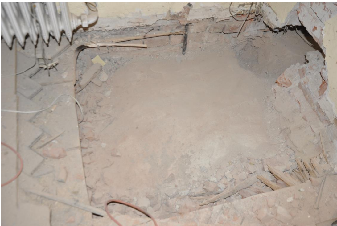
Fot.25/26 Jordanów. Rynek nr.2 Budynek dawnego ratusza i sądu grodzkiego. I piętro. Skrzydło wschodnie od strony Rynku. Odkrytki podłogowe w pomieszczeniu wieży i w sali 1.5.