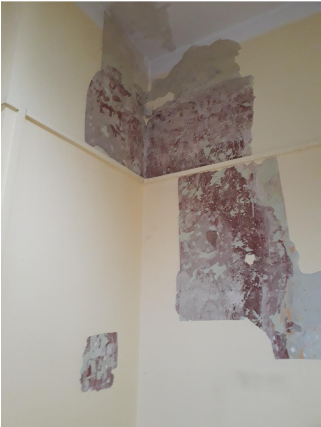
Fot.19. Jordanów. Rynek nr.2 Budynek dawnego ratusza i sądu grodzkiego. I piętro . Skrzydło wschodnie od strony Rynku. Trakt frontowy. Fragment pomieszczenia 1.6 . Narożnik połd. zach. W odkrywce widoczna czerwona monochromia