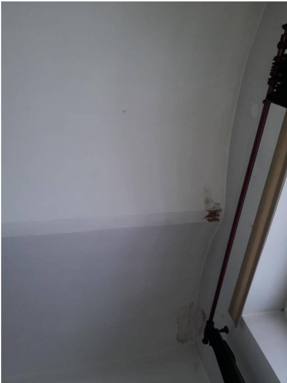
Fot.12. Jordanów. Rynek nr.2 Budynek dawnego ratusza i sądu grodzkiego. Parter. Skrzydło północne. Fragment sklepienia pomieszczenia 0.12.Narożnik płn. wsch. W odkrywce widoczna dekoracja malarska stropu i szczytu ścian, oraz czerwona warstwa malarska na stalowej belce stropowej.