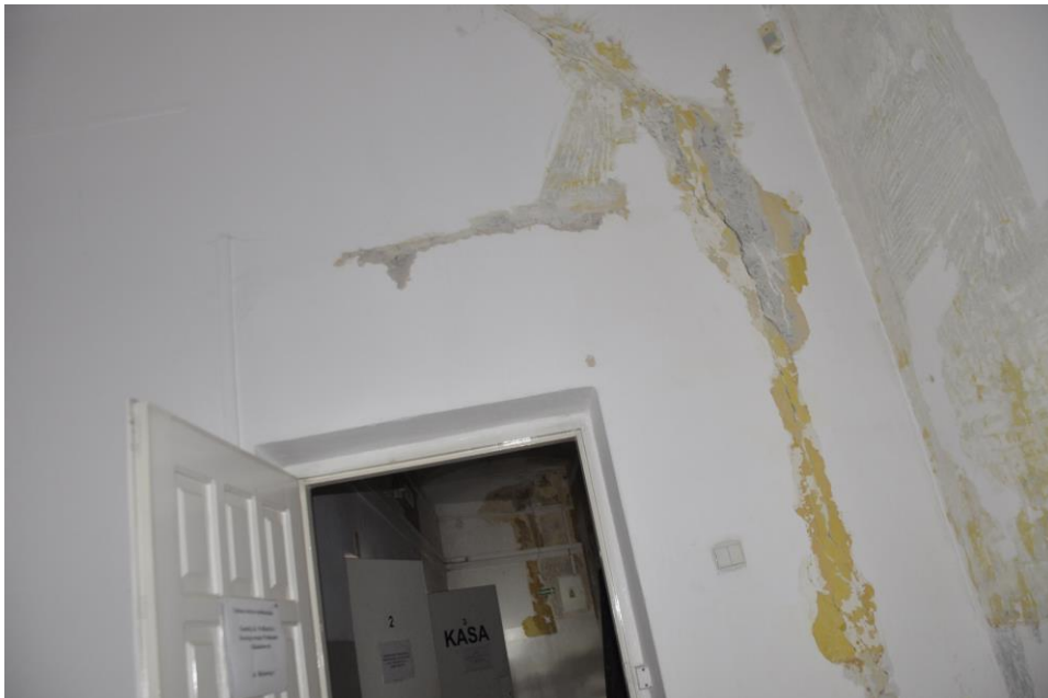
Fot. 33. Jordanów. Rynek nr.2 Budynek dawnego ratusza i sądu grodzkiego. I piętro . Sala. 1.10 . Skrzydło północne , narożnik południowo wschodni , widoczne pęknięcie i rozspojenie sciany wschodniej.