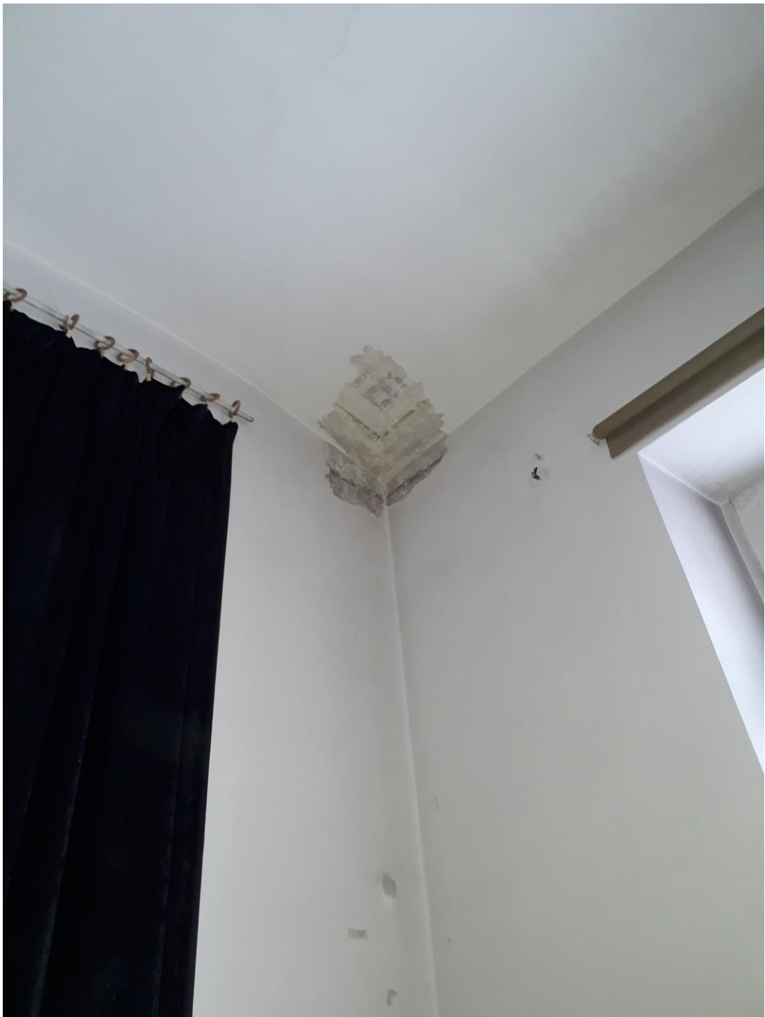
Fot.11. Jordanów. Rynek nr.2 Budynek dawnego ratusza i sądu grodzkiego. Parter. Skrzydło północne. Fragment pomieszczenia 0.13.Narożnik płn. wsch. W odkrywce widoczna dekoracja malarska stropu i szczytu ścian.