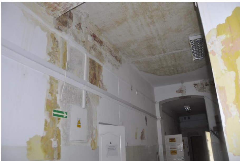
Fot.15. Jordanów. Rynek nr.2 Budynek dawnego ratusza i sądu grodzkiego. Piętro . Skrzydło wschodnie. Fragment klatki schodowej na styku z korytarzem. W odkrywkach widoczna dekoracja malarska .