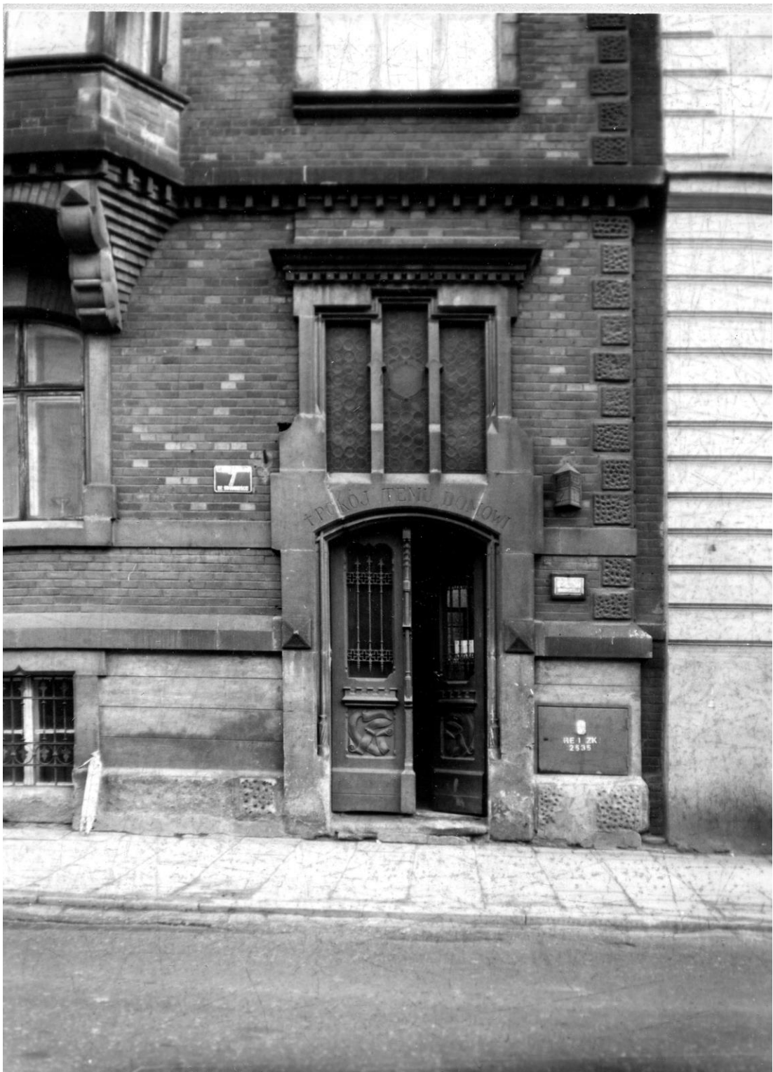
Fot. 40. Zdjęcie archiwalne z 1979 roku , M. Wesołowska, ze zbiorów WUOZ w Krakowie. Przeszklenie nadświetla i brama w portalu na elewacji domu własnego Jana Karola Sas Zubrzyckiego w Krakowie . Al. Słowackiego 7.