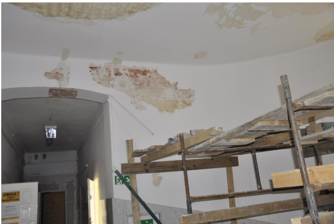
Fot. 13/14. Jordanów. Rynek nr.2 Budynek dawnego ratusza i sądu grodzkiego. Piętro . Skrzydło wschodnie. Fragmenty klatki schodowej W odkrywkach widoczna dekoracja malarska ścian.