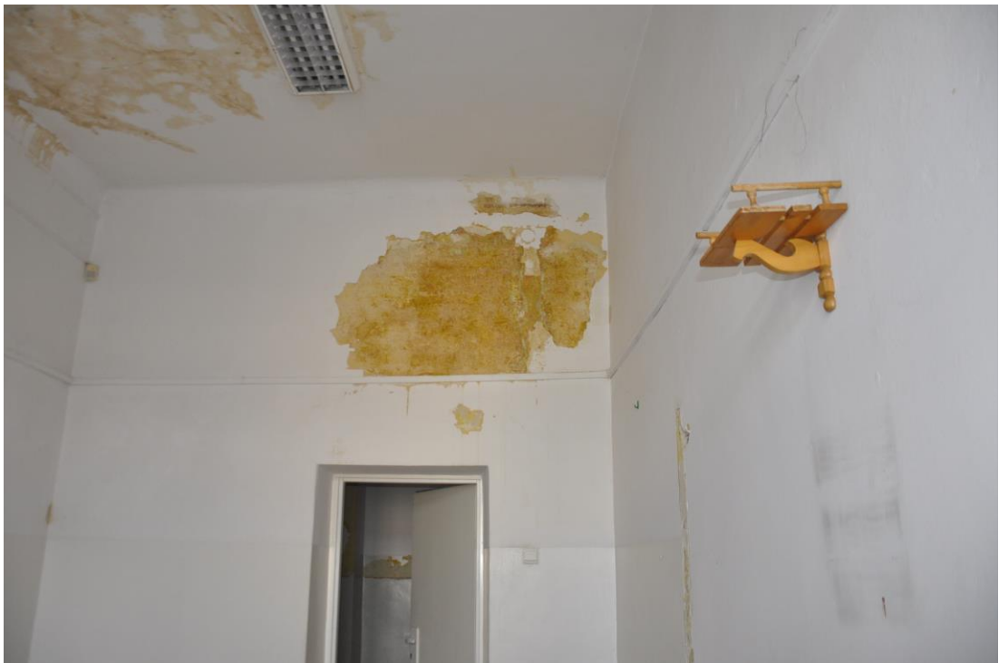
Fot. 30 . Jordanów. Rynek nr.2 Budynek dawnego ratusza i sądu grodzkiego. I piętro . Sala. 1.8 . Skrzydło północne . Fragment narożnika pół zach. Widoczne zalanie na suficie.