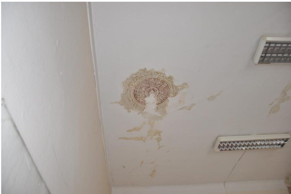
Fot. 28. Jordanów. Rynek nr.2 Budynek dawnego ratusza i sądu grodzkiego. I piętro . Sala. 1.9 . Skrzydło północne . Fragment sufitu , w odkrywce widoczna centralna rozeta pierwotnego pomieszczenia przed podziałem.