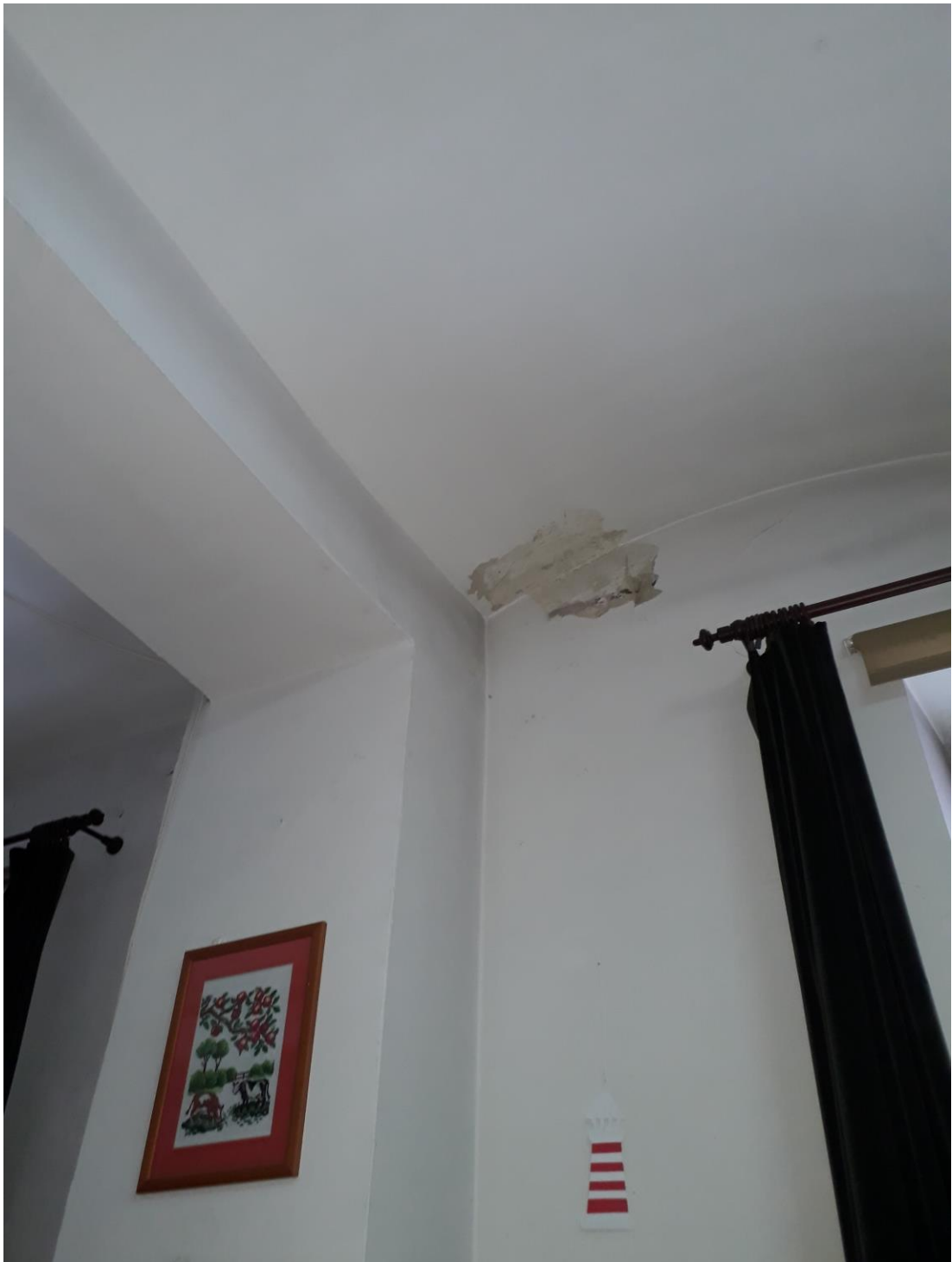
Fot.10 . Jordanów. Rynek nr.2 Budynek dawnego ratusza i sądu grodzkiego. Parter. Skrzydło północne. Fragment przejścia pomiędzy pomieszczeniami 0.12,i 0.13. W odkrywcze widoczna dekoracja malarska stropu i szczytu ściany w pomieszczeniu 0.12