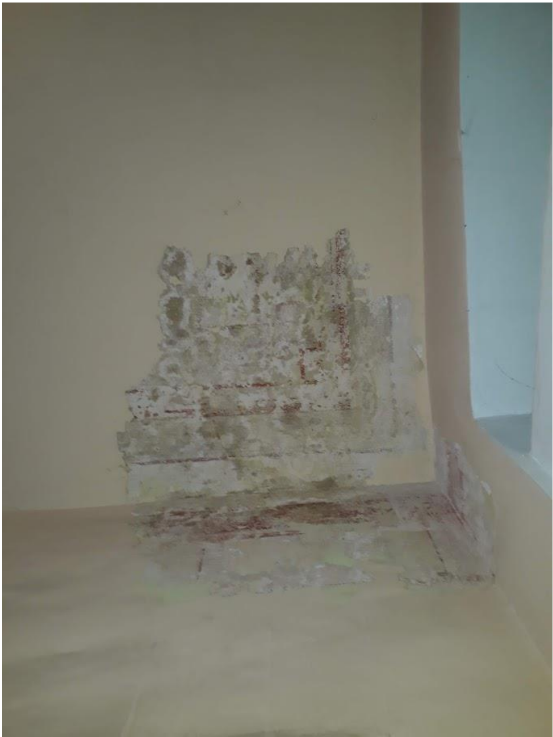
Fot.2 . Jordanów. Rynek nr.2 Budynek dawnego ratusza i sądu grodzkiego. Sień Skrzydło wschodnie od strony Rynku. Trakt frontowy .Narożnik pld. zach ch. . W odkrywce pod nawarstwieniami widoczna dekoracja malarska na sklepieniu i w szczycie ściany.