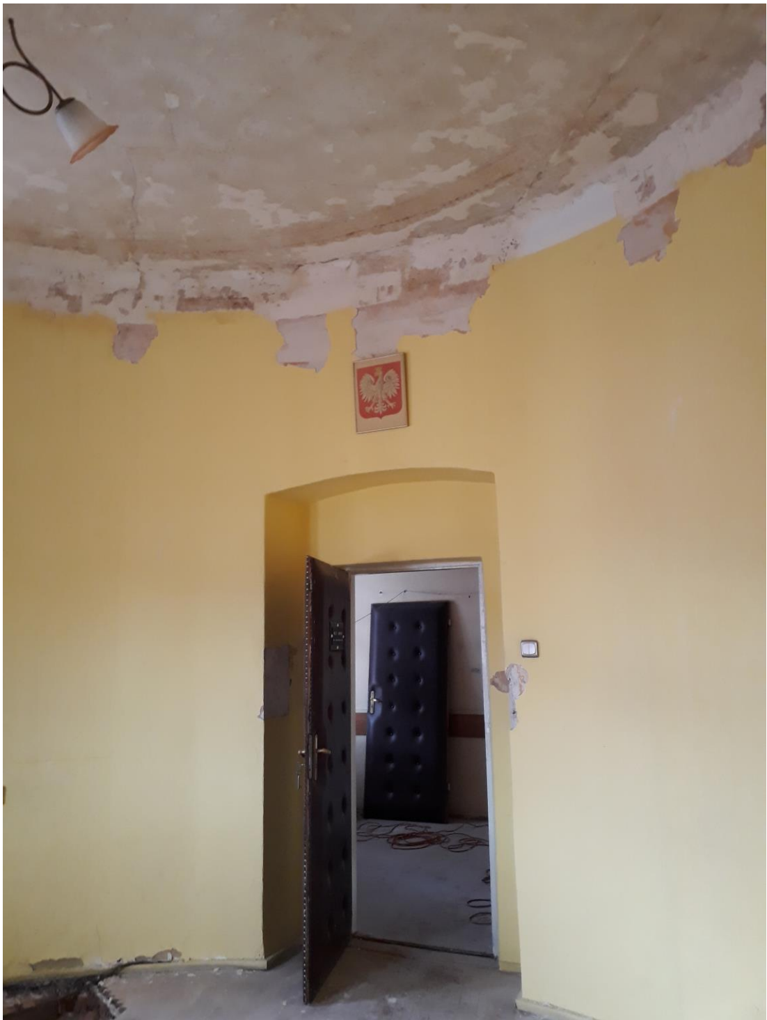
Fot.22. Jordanów. Rynek nr.2 Budynek dawnego ratusza i sądu grodzkiego. I piętro Skrzydło wschodnie od strony Rynku. Trakt frontowy, fragment pomieszczenia 1.7 w okrągłej wieży narożnikowej . W odkrywcę widoczna dekoracja malarska sufitu i szczytu ścian.