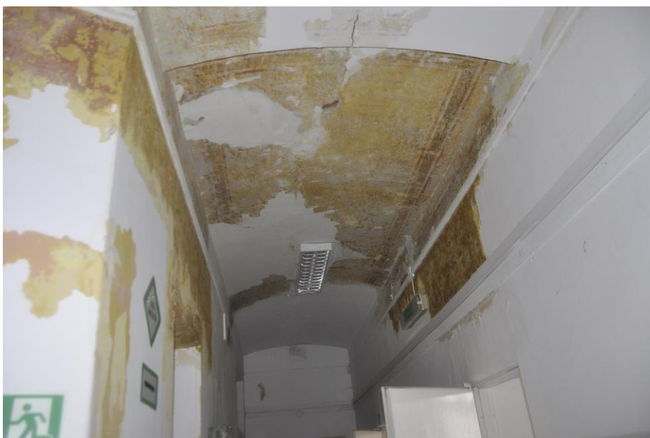
Fot.16. Jordanów. Rynek nr.2 Budynek dawnego ratusza i sądu grodzkiego. Piętro . Skrzydło północne. Fragment korytarza. W odkrywkach widoczna dekoracja malarska .