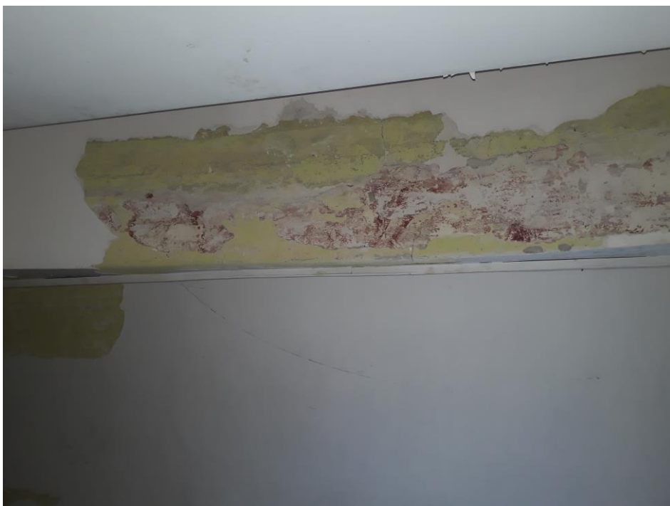
Fot. 4/5. Jordanów. Rynek nr.2 Budynek dawnego ratusza i sądu grodzkiego. Sień Skrzydło wschodnie od strony Rynku. Trakt frontowy . Fragmenty podłuczka w przejściu na klatkę schodową. W odkrywkach pod nawarstwieniami widoczna dekoracja malarska .