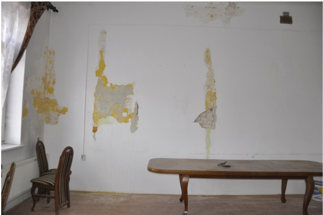
Fot. 34. Jordanów. Rynek nr.2 Budynek dawnego ratusza i sądu grodzkiego. I piętro . Sala. 1.10 . Skrzydło północne , ściana wschodnia , w odkrywkach widoczna pierwotna dekoracja malarska i zamurowany otwór pierwotnego przejścia do sąsiedniej sali.