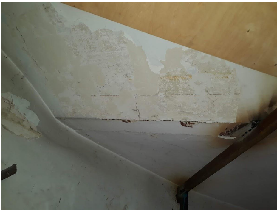
Fot. 7/8. Jordanów. Rynek nr.2 Budynek dawnego ratusza i sądu grodzkiego. Fragmenty stropu w pomieszczeniu parteru wzniesionym na rzucie okręgu w narożnej wieży. W odkrywkach widoczna dekoracja malarska stropu.