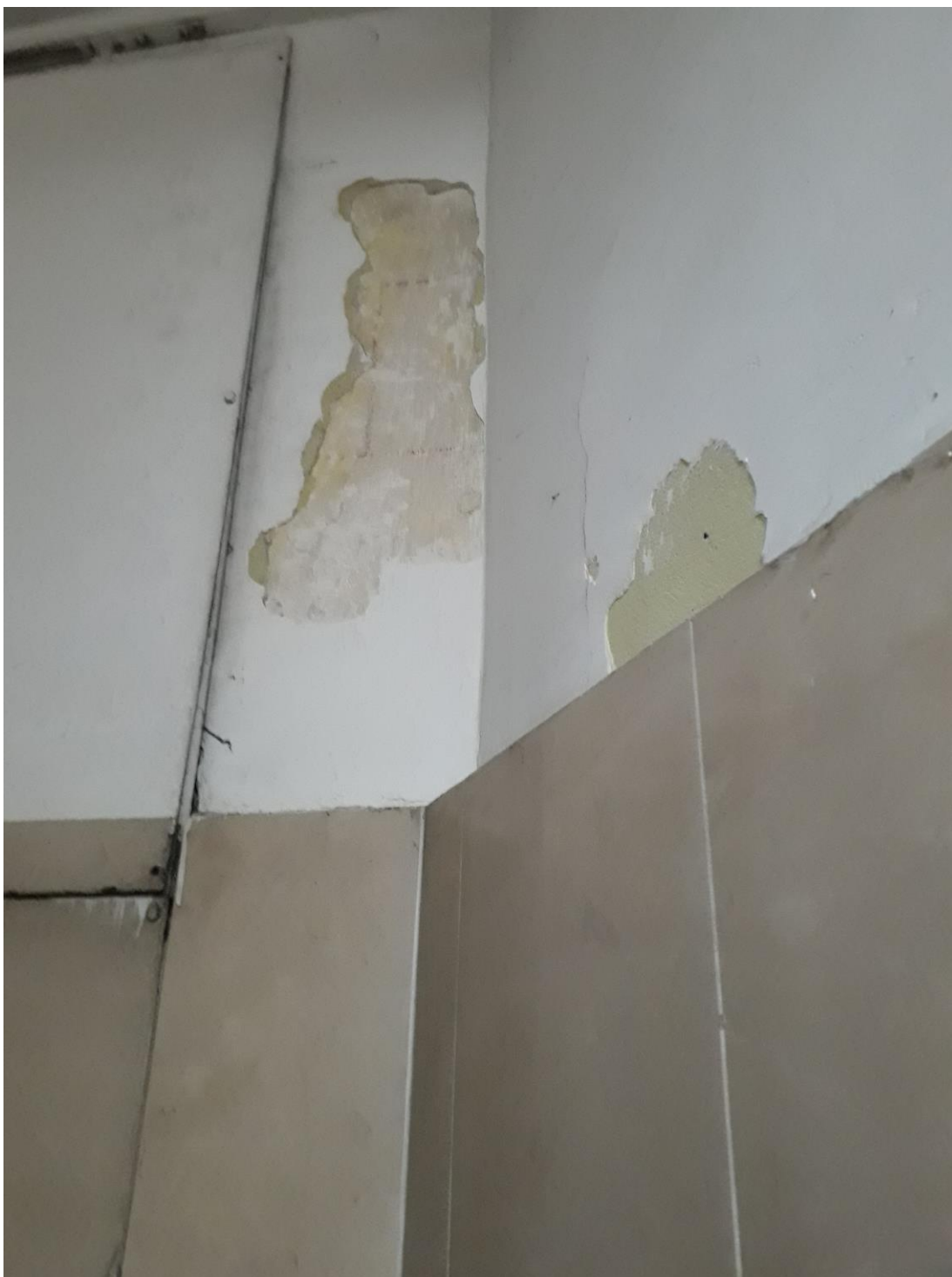
Fot. 6 . Jordanów. Rynek nr.2 Budynek dawnego ratusza i sądu grodzkiego. Korytarz parteru fragment na styku z klatką schodową . Skrzydło północne. W odkrywce widoczna dekoracja malarska w formie boniowania.