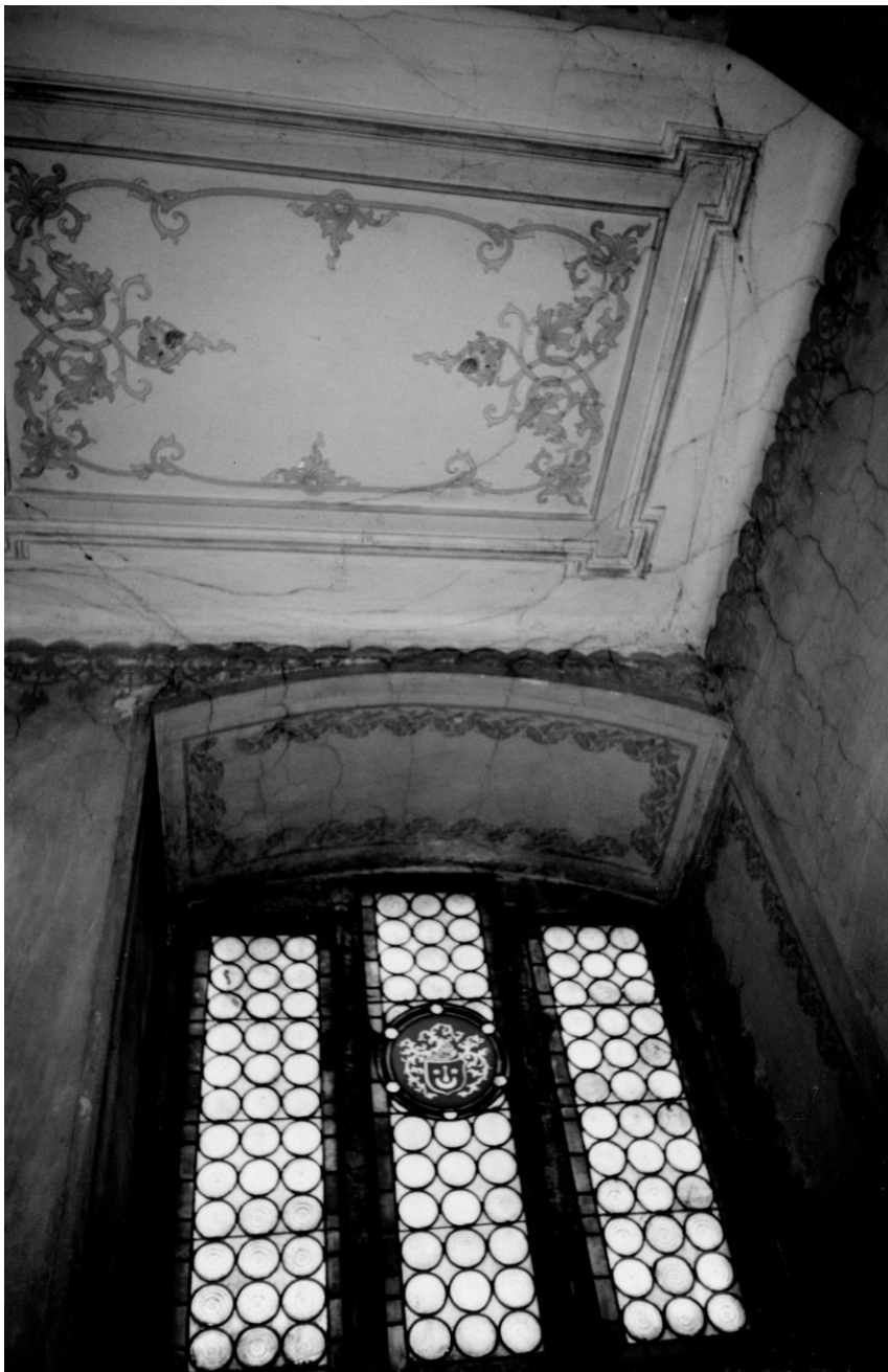
Fot. 39 . Zdjęcie archiwalne z 1979 roku , M. Wesołowska, ze zbiorów WUOZ w Krakowie. Przeszklenie nadświetła powyżej portalu od strony sieni domu własnego Jana Karola Sas Zubrzyckiego w Krakowie . Al. Słowackiego 7..