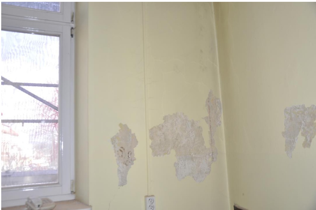
Fot.17,18. Jordanów. Rynek nr.2 Budynek dawnego ratusza i sądu grodzkiego. Piętro . Skrzydło wschodnie. Fragmenty pomieszczenia od strony południowej(Obecnie opisane jako pomieszczenia 1.2, 1.3). W odkrywkach widoczne odsłonięte fragmenty dekoracji malarskiej. Na suficie i ścianach w narożniku pld.wsch.