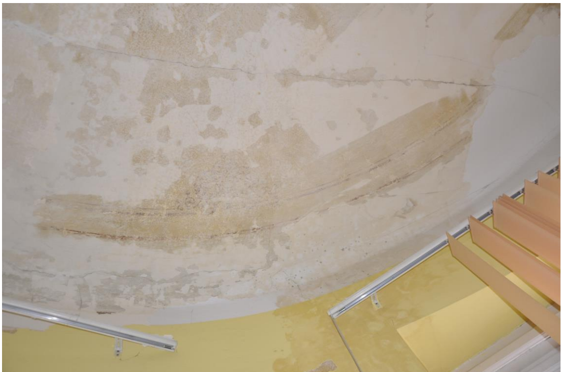
Fot.23/24. Jordanów. Rynek nr.2 Budynek dawnego ratusza i sądu grodzkiego. I piętro Skrzydło wschodnie od strony Rynku. Trakt frontowy, fragmenty sufitu pomieszczenia w okrągłej wieży narożnikowej . W odkrywkach widoczna dekoracja malarska.