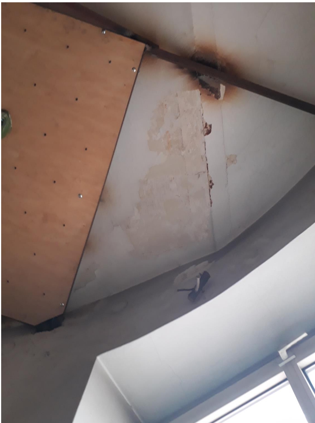
Fot. 9. Jordanów. Rynek nr.2 Budynek dawnego ratusza i sądu grodzkiego. Fragment stropu w pomieszczeniu parteru w narożnej wieży. W odkrywcze widoczna czerwona warstwa malarska na stalowej belce stropowej.