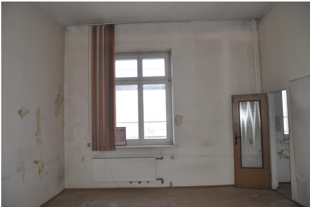
Fot. 27. Jordanów. Rynek nr.2 Budynek dawnego ratusza i sądu grodzkiego. I piętro . Sala. 1.9 . Skrzydło północne . Ściana północna , widoczna od strony wschodniej ścianka działowa.