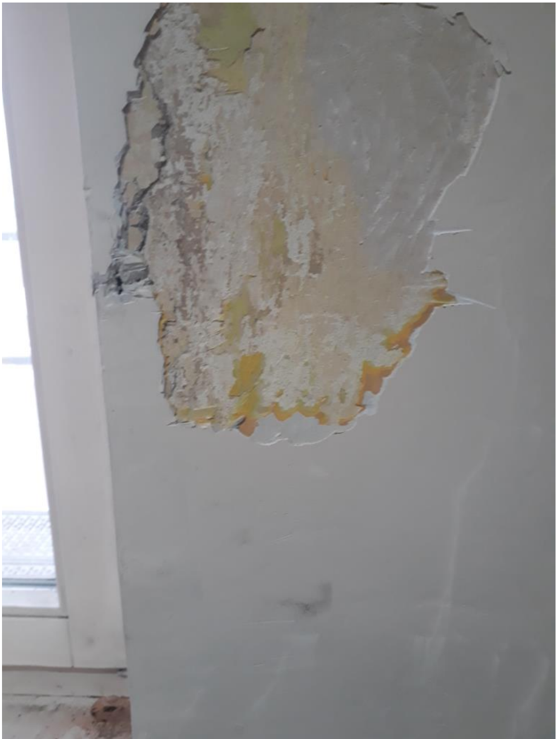
Fot. 31. Jordanów. Rynek nr.2 Budynek dawnego ratusza i sądu grodzkiego. I piętro . Sala. 1.9 . Skrzydło północne . Fragment ściany północnej , w odkrywce widoczna skuta szpaleta , wykończona regipsem od strony otworu okiennego. Zniszczenia dokonano w trakcie wymiany stolarki okiennej.