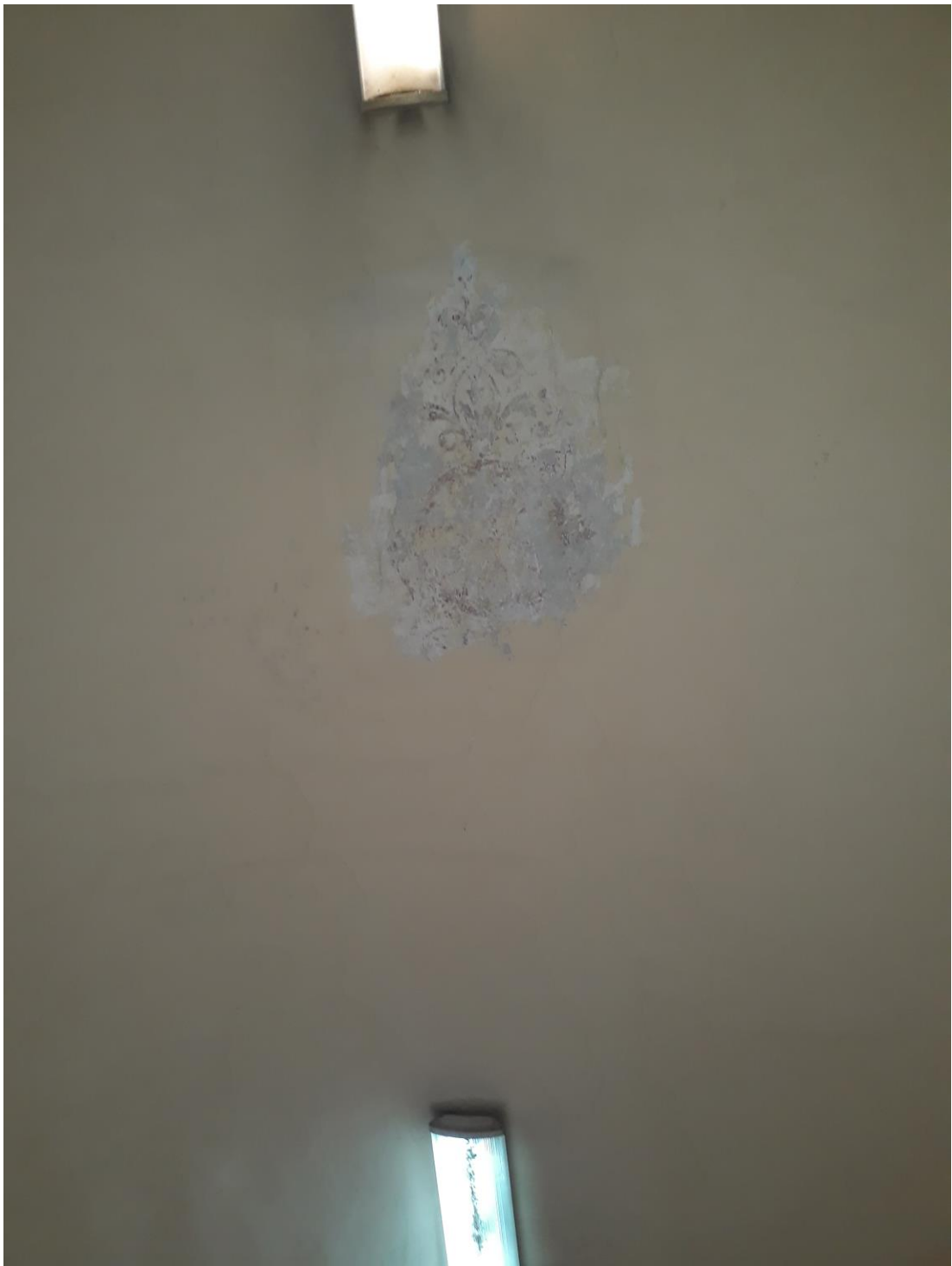
Fot.3 . Jordanów. Rynek nr.2 Budynek dawnego ratusza i sądu grodzkiego. Sień Skrzydło wschodnie od strony Rynku. Trakt frontowy . Fragment sklepienia . W odkrywce pod nawarstwieniami widoczna dekoracja malarska w formie centralnej rozety, wydłużonej na osi wsch.zach.