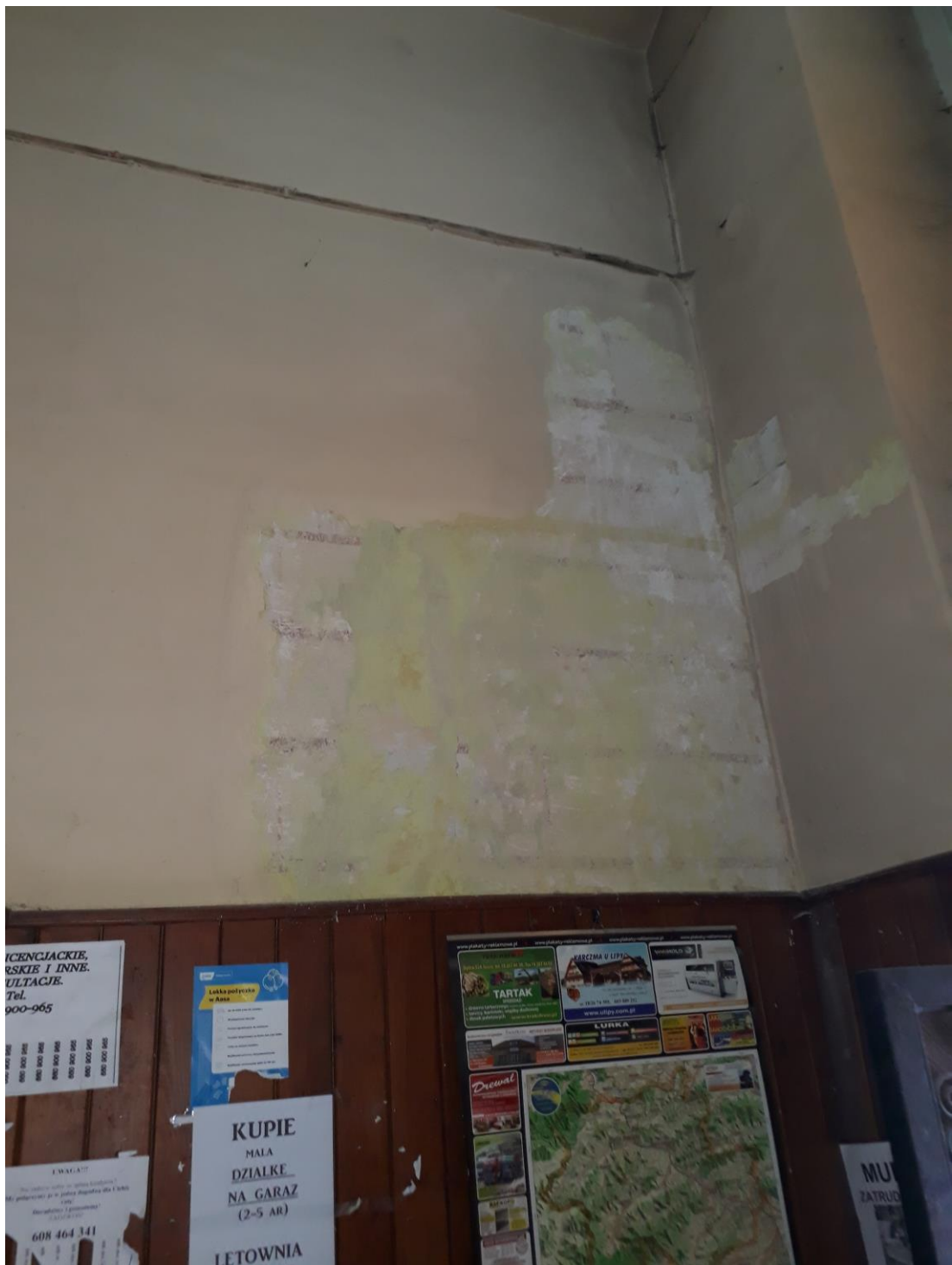
Fot.1. Jordanów. Rynek nr.2 Budynek dawnego ratusza i sądu grodzkiego. Śień Skrzydło wschodnie od strony Rynku. Trakt frontowy .Narożnik płn.wsch. . W odkrywce pod nawarstwieniami widoczna dekoracja malarska w formie boniowania.