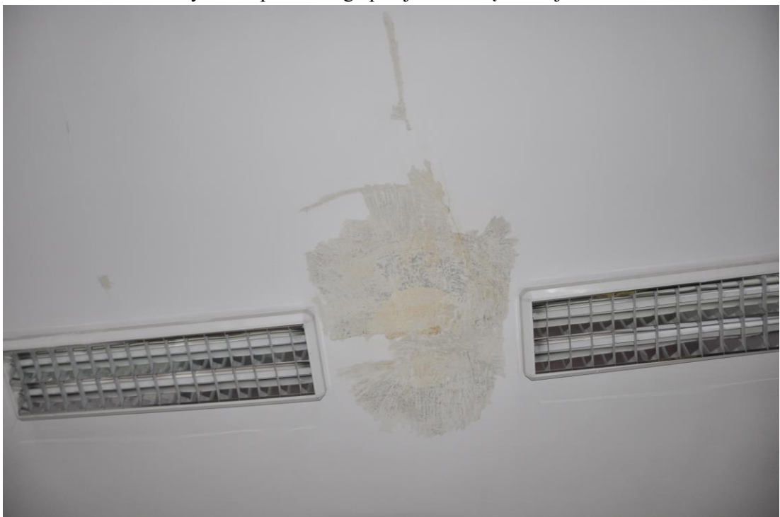
Fot. 35. Jordanów. Rynek nr.2 Budynek dawnego ratusza i sądu grodzkiego. I piętro . Sala. 1.10 . Skrzydło północne , fragment sufitu z widoczną w odkrywce dekoracja malarska centralnej rozety.