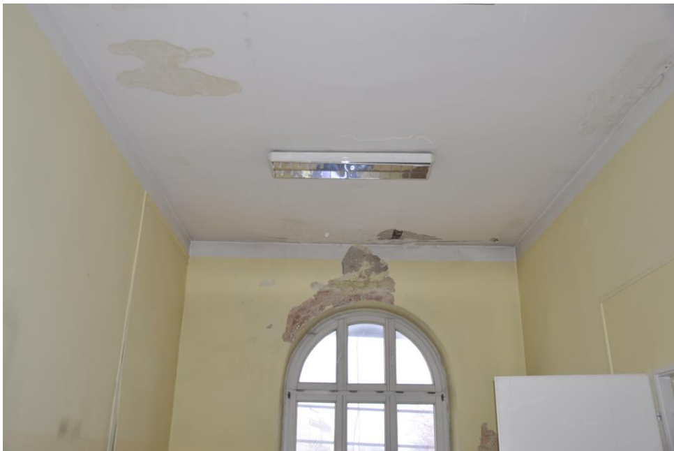
Fot.20 . Jordanów. Rynek nr.2 Budynek dawnego ratusza i sądu grodzkiego. I piętro Skrzydło wschodnie od strony Rynku. Trakt frontowy. fragment ściany wschodniej pomieszczenia 1.5. W odkrywcę widoczna czerwona monochromia i zaprawa cementowa w szczycie ściany . W odkrywcę na suficie widoczny wtórny strop betonowy wsparty na belkach stalowych.