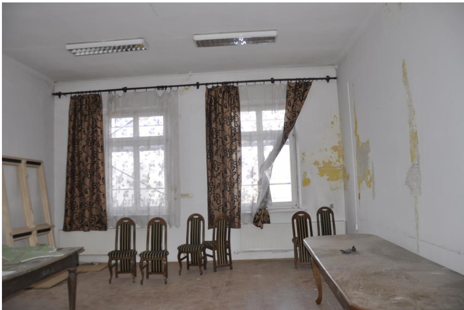
Fot. 32. Jordanów. Rynek nr.2 Budynek dawnego ratusza i sądu grodzkiego. I piętro . Sala. 1.10 . Skrzydło północne . Ściana północna.